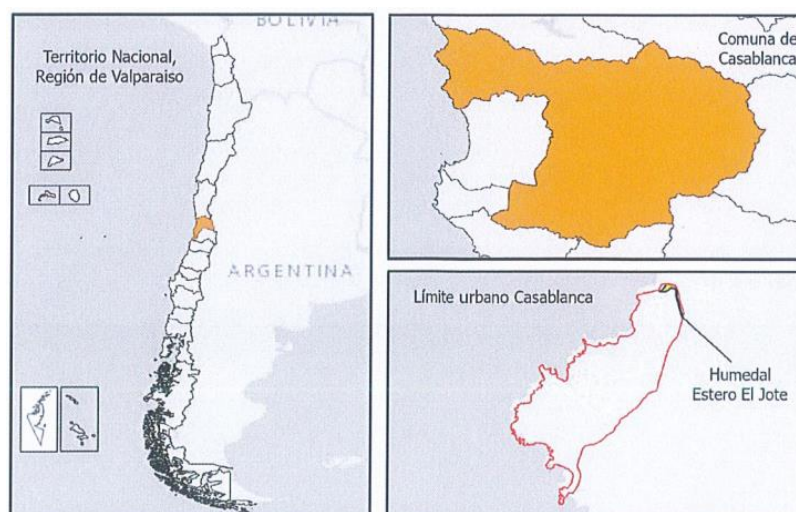
Ubicación geográfica

Mediante Resolución Exenta N°1430 de fecha 21 de diciembre de 2023, el Ministerio del Medio Ambiente reconoce, por solicitud municipal, la declaración de humedal urbano del “Estero El Jote”, el que se ubica en el límite norte de la zona urbana del sector de Playa Grande de la localidad de Quintay.